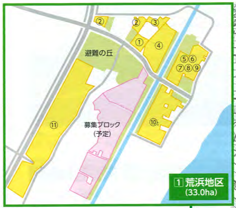
1 荒浜地区 (33.0ha)