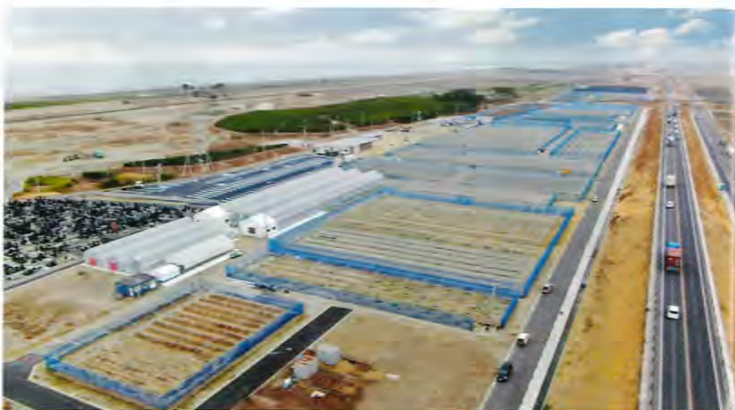
スマート農業の実践地として、最新技術を積極的に取り入れることで、作物が育ちやすい環境を整備。今後、収穫された果物は、首都圏や海外への出荷も視野に入れている。