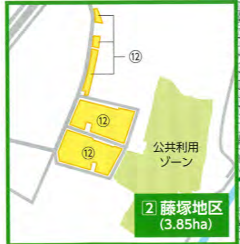
2 藤塚地区 (3.85ha)