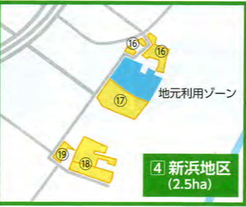
4 新浜地区 (2.5ha)