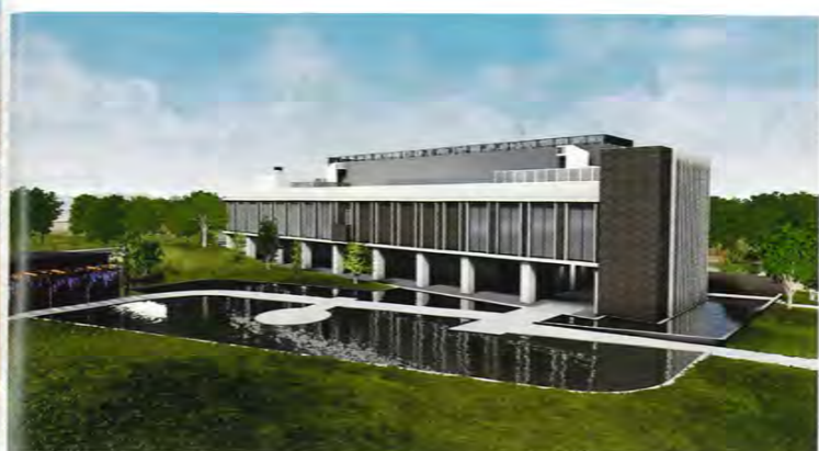
本施設には、地球温暖化の原因になりにくい「地中熱回収システム」が東北で初めて導入されるなど、地域の環境にも配慮。さまざまな面で復興・創生のシンボルとなる施設を目指す。

三者に共通するのは、「町のにぎわいを取り戻そう」という意志。国内外からの復興支援への感謝と、100万人規模の都市が津波によって甚大な被害を受けた経験を伝えること、そして、震災前にこの地域で暮らしていた住民の方々に、喜んでいただけるようなエリアにすることを目標に、ゆったりとした時間を過ごすことができる施設にしていきたいと考えています。そのためにも、藤塚を含む5地区で事業を行う皆さんとの連携はもとより、名取の「かわまちテラス閉上」や整備が進む貞山堀周辺、「名取市サイクルスポーツセンター」といった周辺地域の施設なども含めて、新たな観光ルートを形成できたらすばらしいと思っています。また、企業内保育所を設けるなど、従業員の働きやすい環境も整備し、積極的に地域の方々にも入っていただきたいと考えています。復興の集大成として、「東部地域がこんなに楽しい場所になったね」と多くの方々に言ってもらえるよう、努めたいと思います。