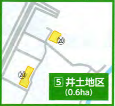
5 井土地区 (0.6ha)