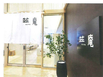
ライブラリーカフェ