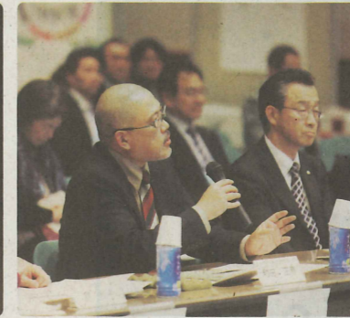
取り組みによる成果や今後の展望について審査員が質問します