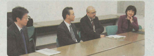
発表前の緊張の瞬間…