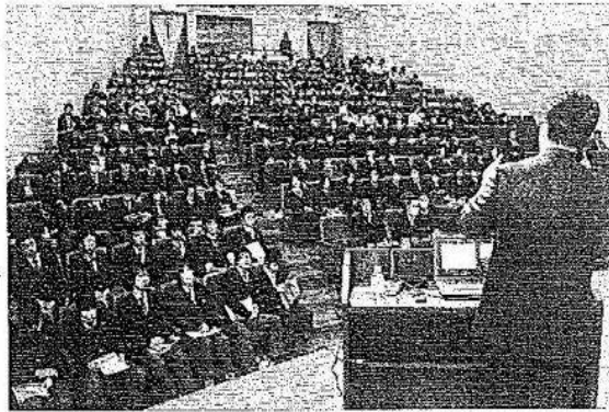
復興作業を支えた仙台建設業協会幹部の話に耳を傾ける高校生ら —横浜市栄区民文化センター「リリス」

高齢化が進む一方で、若者離れが深刻さを増す建設業。こうした状況に危機感を抱いた県建設業協会(横浜市中央区)は12日、県内の工業高校に通う生徒を対象としたフォーラムを同市栄区で開催した。東日本大震災の発生初期から復興作業に携わった仙台の業者らが講演。市民の生活基盤を支える建設業のやりがいと熱く語った。